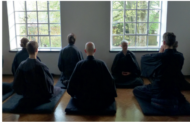
Sesshin à Grube-Louise.

sagesse) et respecter le Bouddha, son enseignement et la communauté de ceux qui pratiquent cet enseignement. Ils font vœu de s'éveiller à la profonde dimension de la Voie et de partager avec tous les êtres la pratique de cet Éveil en les aidant à remédier aux attachements causes des souffrances. Aussi ils étudient et pratiquent les enseignements de Bouddha et des maîtres de la transmission du zen Sōtō.