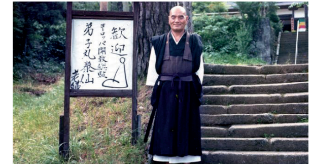
Maître Taisen Deshimaru.

Notre pratique est une pratique de « libération » de toutes les causes de souffrance liées à notre avidité, notre agressivité et notre ignorance qui sont les trois poisons de base évoqués par le Bouddha. Il s'agit pour chacun de veiller à ne pas laisser se développer les phénomènes de rivalité, d'emprise, d'abus de pouvoir et autres attachements qui pervertissent fréquemment le fonctionnement des organisations, particulièrement des églises et des communautés dites « spirituelles ». Etre capable d'en prendre conscience et d'y remédier s'ils se produisent fait partie de la formation des enseignants et de la pratique de chacun : ceci implique sagesse et vigilance.